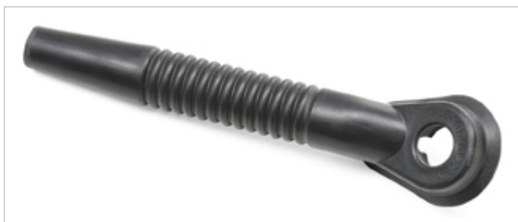
Odsávání vrtání se nasune na sací hadici FLEX nebo na různé adaptéry, tím dochází k tomu, že se prach odsává přímo u vrtané díry. Nevznikají žádné zbytky prachu. Pro vrtací práce do průměru vrtání 24 mm.