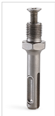
Adaptér pro sklíčidlo 1/2" (obj.č. 272.639).