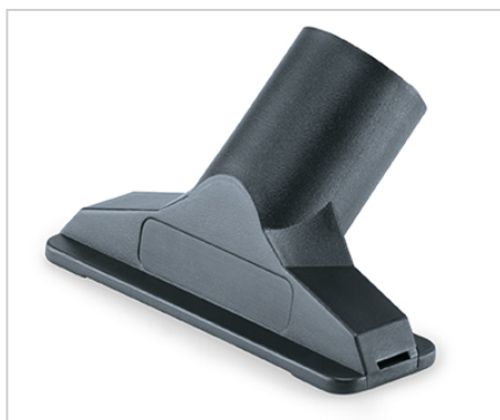
Hubice na polštáře, průměr 36 mm, šířka 115 mm.