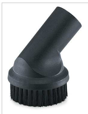
Kulatá sací hubice s kartáčovým lemem na čištění citlivých povrchů. Průměr 36 mm, délka 120 mm.