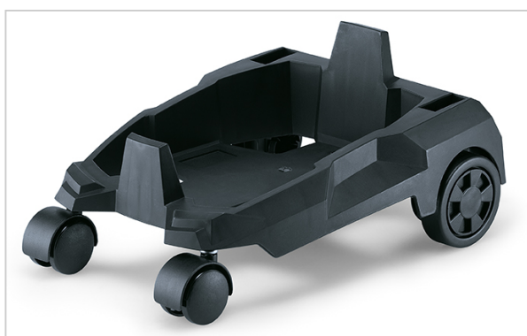
Podvozek pro VC 6, jednoduše připnutelný.