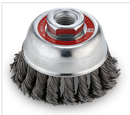
copánkový, upnutí M 14